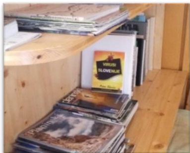
Slika levo: Prodaja v lokalih, kavarnah na način: »Ob nakupu knjige prejmete kavo brezplačno.«