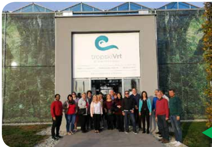
Ocean Orchids Dobrovnik

ter njihovo proizvodnjo. Zadnja točka izmenjave izkušenj je bilo podjetje Ocean Orchids Dobrovnik, kjer so si ogledali njihove prostore in tropski vrt. Izmenjava izkušenj med šolami je bila zelo uspešna in koristna, saj so tako slovenski kot madžarski šolski delavci, ki se ukvarjajo s poklicno orientacijo mladih dobili ogromno informacij.