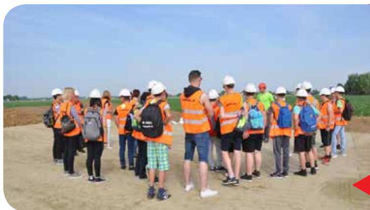
Ogled podjetij za mlade – Pomgrad d.o.o.

Za učence zaključnih razredov osnovnih šol Pomurja in Železne županije smo organizirali pet pilotnih ogledov podjetij. Pomurski učenci so si na dveh ogledih ogledali sedem pomurskih podjetij. V Železni županiji pa so si osnovnošolci ogledali znana podjetja iz njihove regije.