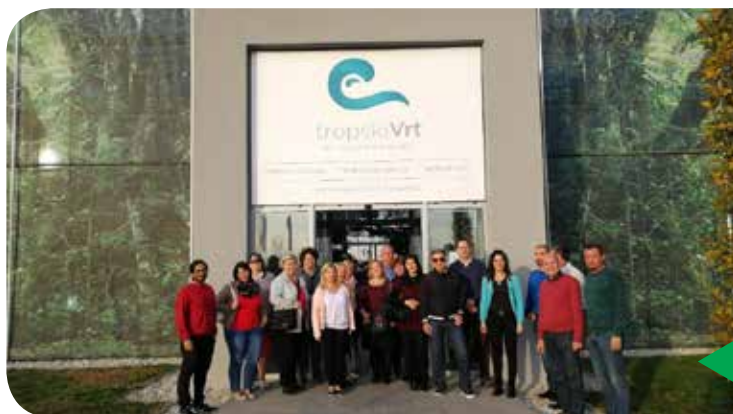
Dobronaki Ocean Orchids

A másik szakmai kiránduláson a magyarországi pedagógusokat láttuk vendégül Muravidéken. Lendván ellátogattak a Kétnyelvű Középiskolába, ahol bemutatták számukra az oktatási programokat és a szlovéniai oktatási rendszert. Megtekintették a Virs Lendava vállalatot és a termelést. A tapasztalatcsere utolsó pontja az Ocean Orchids vállalat volt Dobronakon, ahol megtekintették a helyiségeket és a trópusi kertet. Az iskolák közötti tapasztalatcsere eredményes és hasznos volt, hiszen mind a szlovén mind a magyar oktatásban dolgozók, akik a fiatalok pályaeorientációjával foglalkoznak, sok hasznos információt kaptak.