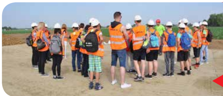
A fiatalok vállalatlátogatása – Pomgrad d.o.o.

A muravidéki és a Vas megyei általános iskolák végzős diákjai számára öt vállalatlátogatást szerveztünk. A muravidéki diákok két látogatás keretében hét muravidéki vállalatot kerestek fel. Vas megyében pedig az általános iskolák diákjai a régiójuk közismert vállalataiba látogattak el.