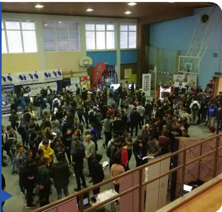
Vállalatok bemutatása a muraszombati középiskolában

Voltak szélesebb körben történő bemutatkozások is, mint pl. a foglalkoztatási piac a muraszombati középiskolában, amelyen 23 muravidéki vállalat képviselője és 800 diák vett részt. A vállalatok képviselői ismertették a tevékenységüket, programjaikat és az elhelyezkedési lehetőségeket, a diákok pedig nagy érdeklődést tanúsítottak és szívesen hallgatták meg a vállalati képviselők tájékoztatásait. A mi feladatunk jelenleg megteremteni a fiatalok részére a feltételeket, hogy tudásukat, érdekeiket a hazai térségben kamatoztathassák, és hogy Muravidék váljon a gazdasági lehetőségek régiójává.