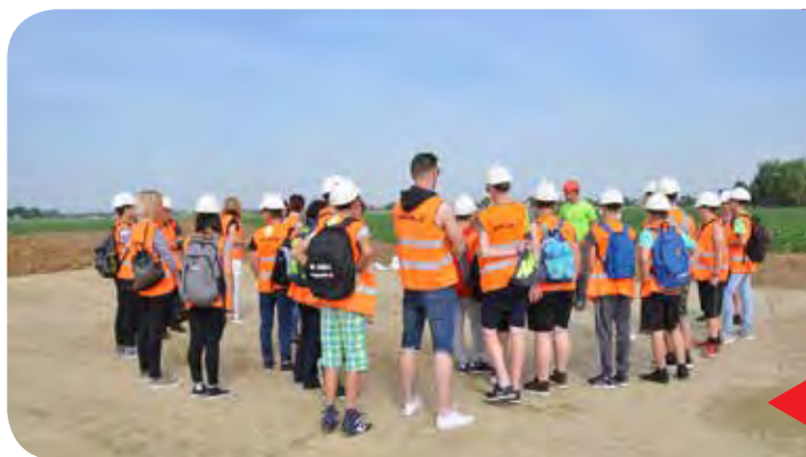
Ogled podjetij za mlade – Pomgrad d.o.o.

Za učence zaključnih razredov osnovnih šol Pomurja in Železne županije smo organizirali pet pilotnih ogledov podjetij. Pomurski učenci so si na dveh ogledih ogledali sedem pomurskih podjetij. V Železni županiji pa so si osnovnošolci ogledali znana podjetja iz njihove regije.