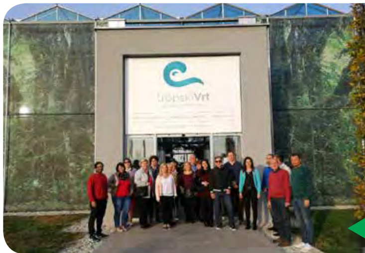
Ocean Orchids Dobrovnik

ter njihovo proizvodnjo. Zadnja točka izmenjave izkušenj je bilo podjetje Ocean Orchids Dobrovnik, kjer so si ogledali njihove prostore in tropski vrt. Izmenjava izkušenj med šolami je bila zelo uspešna in koristna, saj so tako slovenski kot madžarski šolski delavci, ki se ukvarjajo s poklicno orientacijo mladih dobili ogromno informacij.